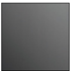
Black High Gloss