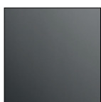
Black High Gloss