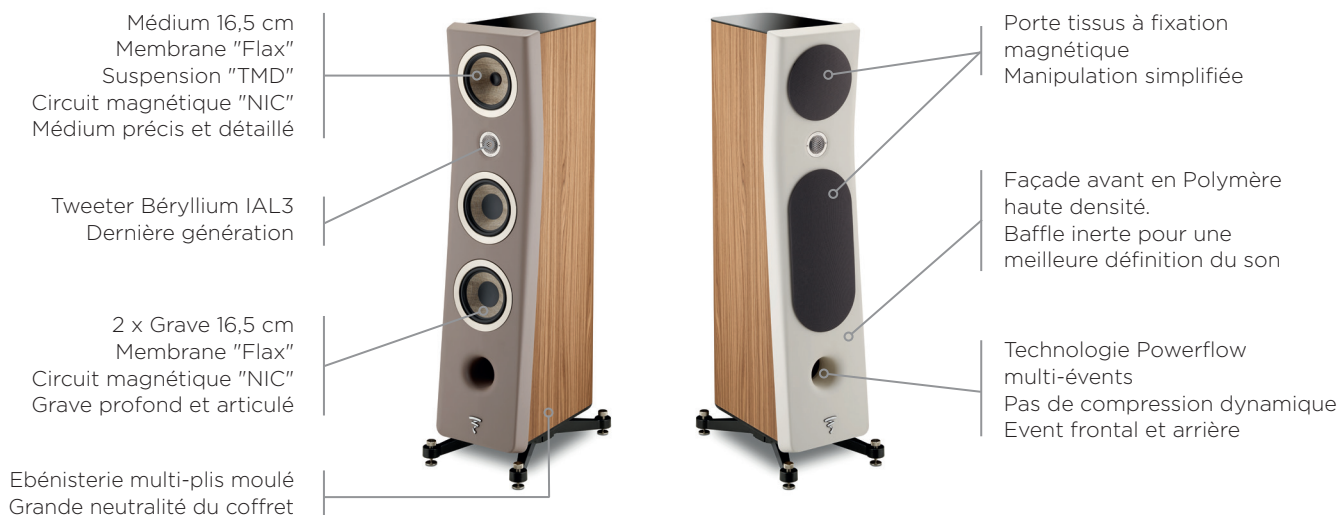
Kanta N°2, Ebénisterie Walnut, Façades Warm Taupe et Ivoire Mat

Kanta N°2 est une enceinte colonne 3 voies totalement orientée vers la performance. Kanta N°2 arbore une nouvelle génération de tweeter IAL avec un dôme inversé en Beryllium avec des transducteurs à membrane sandwich Flax, c'est une alliance de technologies jamais réalisée à ce jour de manière à obtenir un son précis, détaillé et chaud à la fois. Toutes les dernières innovations de Focal en termes d'acoustique sont implémentées dans cette colonne au design résolument moderne et disruptif. Parfaitement à l'aise dans des salons de moins de 30 m 2 , elle s'adaptera également à de plus larges pièces allant jusqu'à 60 m 2 .